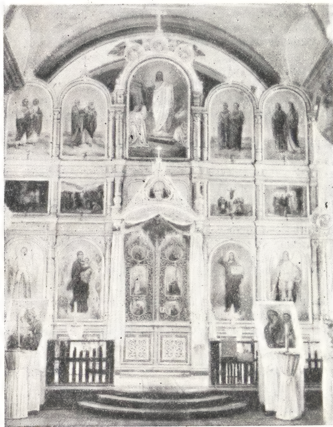
ИКОНОСТАС ГЛАВНОГО АЛТАРЯ В ПЕНЗЕНСКОМ УСПЕНСКОМ СОБОРЕ

6 апреля исполнилось семь лет со дня открытия Пензенского Успенского собора (б. Мироносицкой церкви).